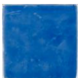
Azul MA1011 • T177