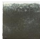
Acero MA1051 • T235