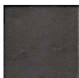
Mate Negro* MA1071 • T177