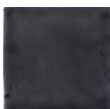
Gris T-5 MA1045 • T177