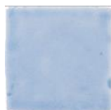
Azul T-9 MA1009 • T177