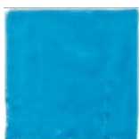
Azul T-10 MA1010 • T177