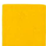
Amarillo T-5 MA1016 • T177