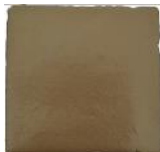
Aurum MA1055 • T235