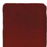
Frambuesa MA1048 • T177