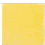
Amarillo MA1015 • T177