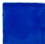
Azul T-8 MA1008 • T177