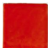
Kaqui MA1019 • T177