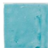
Verde Mar MA1024 • T177