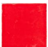
Rojo MA1032 • T177