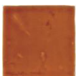
Amarillo Miel MA1017 • T177