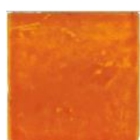
Naranja MA1021 • T177