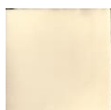
Crema T-1 MA1013 • T177