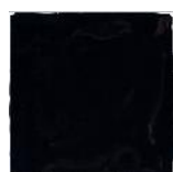
Negro MA1037 • T177