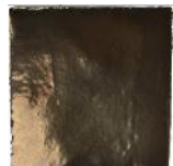
Oro brillo MA1053 • T235