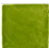
Verde T-5 MA1026 • T177