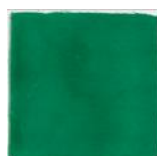
Verde T-4 MA1050 • T177