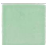
Verde T-2 MA1025 • T177