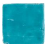
Verde Azulado MA1027 • T177