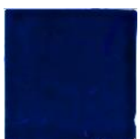
Azul Cobalto MA1012 • T177