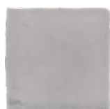
Gris T-2 MA1042 • T177