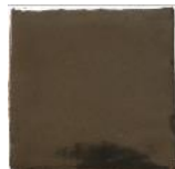
Bauxita MA1054 • T235