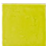
Pistacho MA1018 • T177