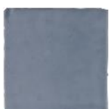
Gris T-4 MA1044 • T177