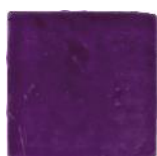
Morado MA1033 • T177