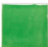
Verde T-3 MA1049 • T177