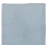
Gris T-3 MA1043 • T177