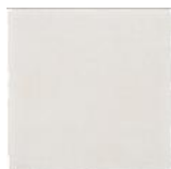
Blanco Cristal MA1006 • T177