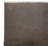
Ferro MA1052 • T235