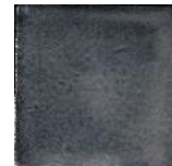
Metalizado MA1036 • T177

Metallic glazuren zijn gevoelig voor verkleuring bij gebruik van zuren zoals bijvoorbeeld citroen en azijn in schoonmaakmiddelen. Deze tegels mogen alleen met schoon water worden afgenomen daarna direct drogen met een schone doek. Alleen geschikt voor droge toepassingen.