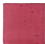
Rosa MA1030 • T177