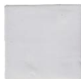
Blanco Antic MA1002 • T177