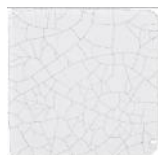
Craquele MA1007 • T177