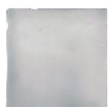
Gris T-1 MA1041 • T177