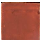
Miel MA1020 • T177