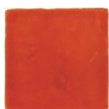
Naranja T-10 MA1023 • T177