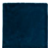
Azafata T-1 MA1046 • T177