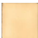
Crema T-2 MA1014 • T177