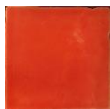
Naranja T-5 MA1022 • T177