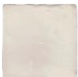
Almond MA1003 • T177