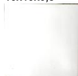
Blanco MA1001 • T177