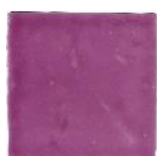
Fucsia MA1031 • T177