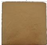
Fiebre del Oro MA1056 • T235