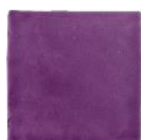
Lila MA1034 • T177