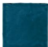
Azafata T-2 MA1047 • T177